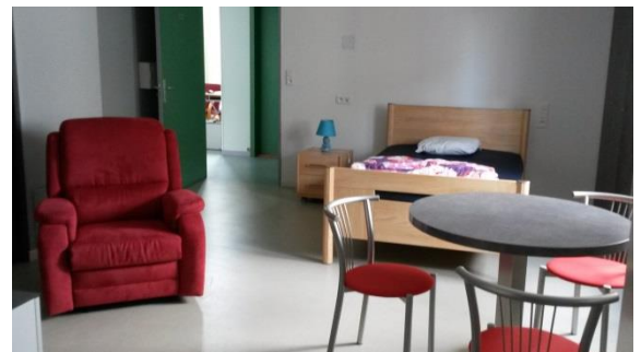
Chambre d'Accueil Temporaire